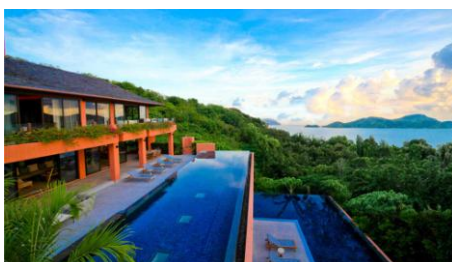
Phuket Gran Hotel Residence