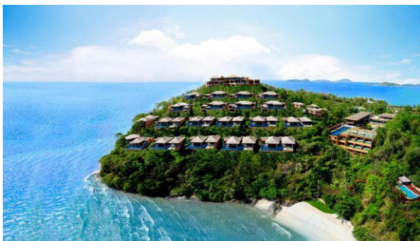
Sri Panwa Luxury Hotel Phuket