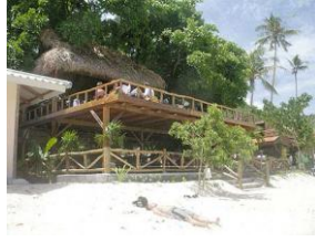
Sand Bar, Phi Phi